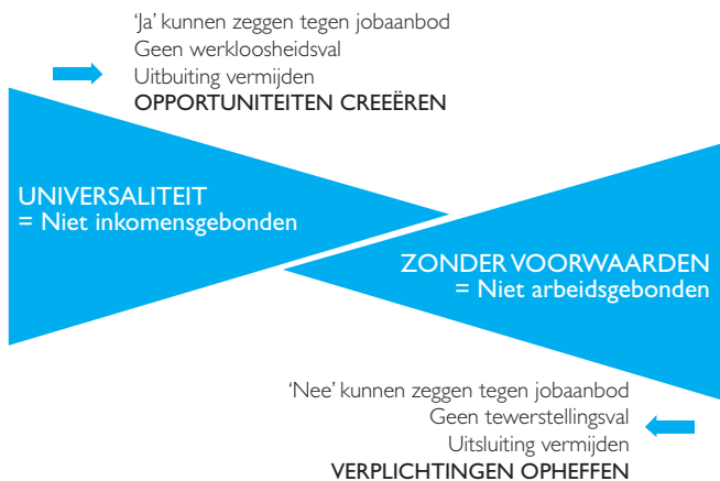
Figuur 1: Universaliteit en onvoorwaardelijk karakter basisinkomen