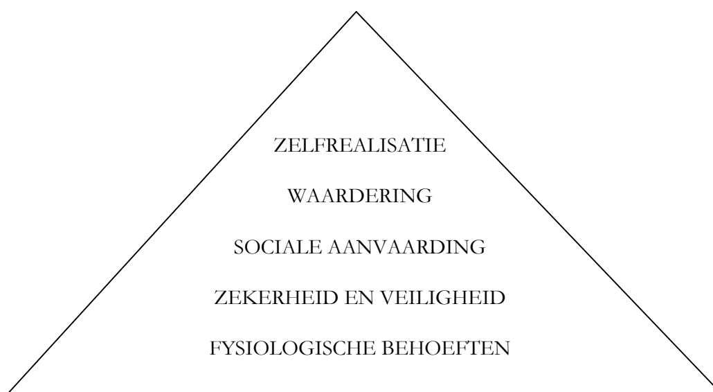
Figuur 2 De behoeftepiramide van Maslow