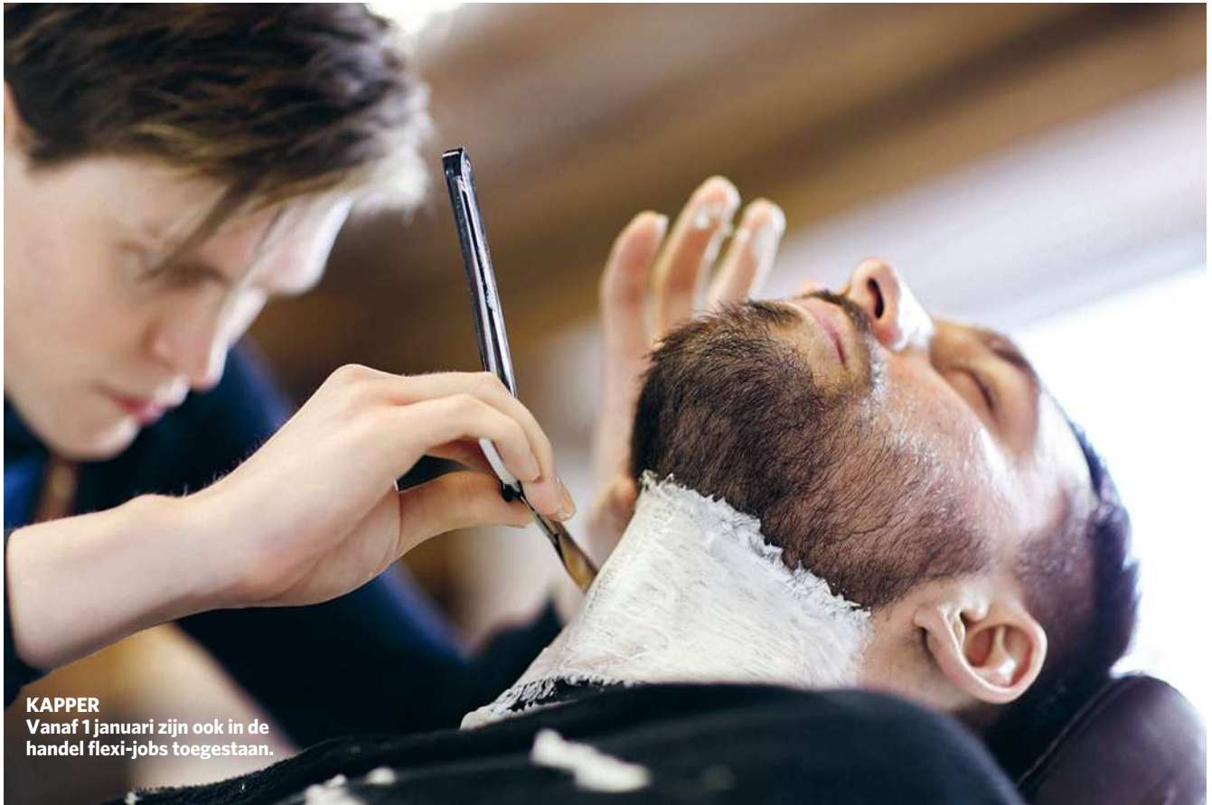
KAPPER Vanaf 1 januari zijn ook in de handel flexi-jobs toegestaan.

DEELTIJDS WERK IS MEEST POPULAIRE VORM VAN FLEXIBEL WERK