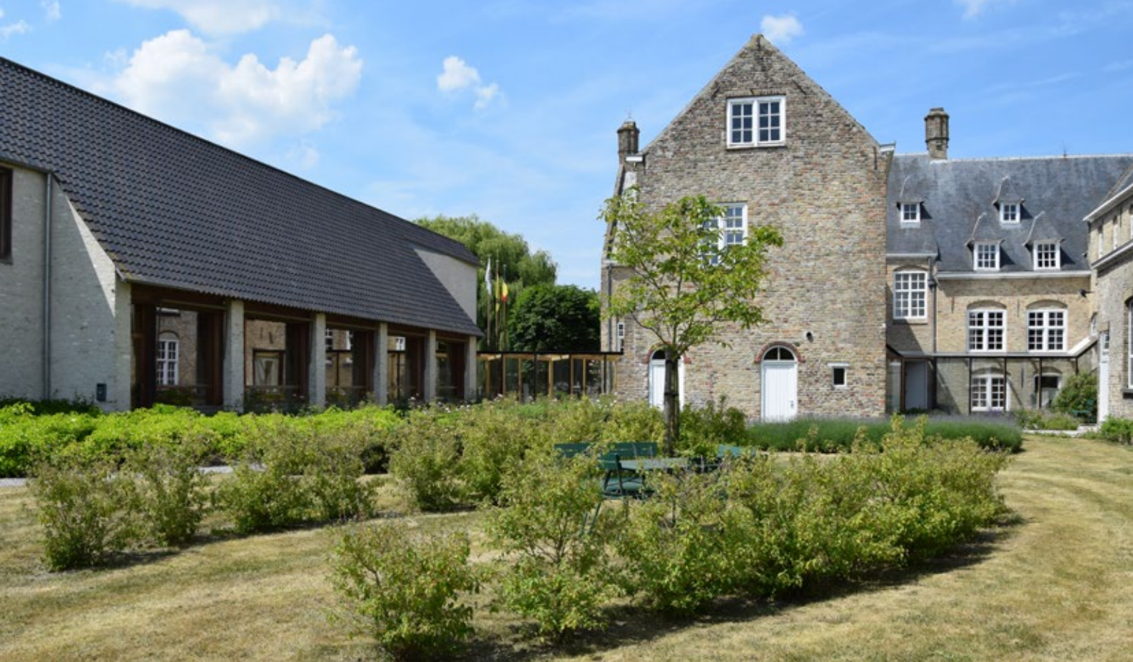
Gemeentehuis Lo-Reninge: Volgens Miek Goossens is de restauratie van dit gemeentehuis een geslaagd voorbeeld van een voorbeeldige restauratie in combinatie met hedendaagse architectuur.

de bouw- en de sloopvergunningen. En dat moet nu ook doorgetrokken worden naar het erfgoed.”