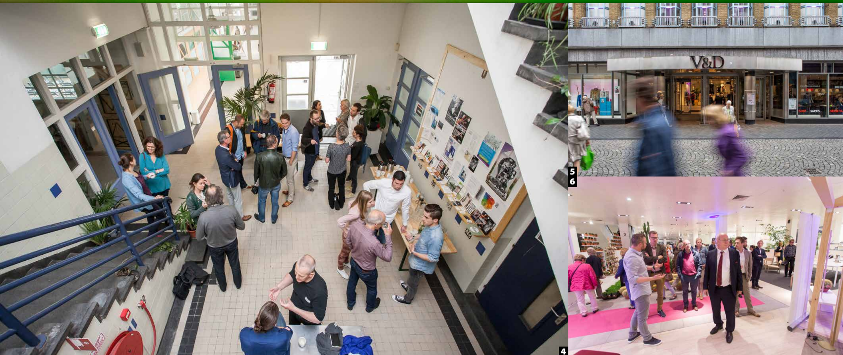
1 Caracola: co-working spaces in een oud schoolgebouw 2 Vastgoedaanbod in Maastricht (Google Maps) 3 De Brandweer 4 Caracola: interieur van het schoolgebouw. 5 Temporama: een tijdelijke pop-up mall in het voormalige pand van de V&D. 6 Temporama: interieur van de tijdelijke pop-up mall