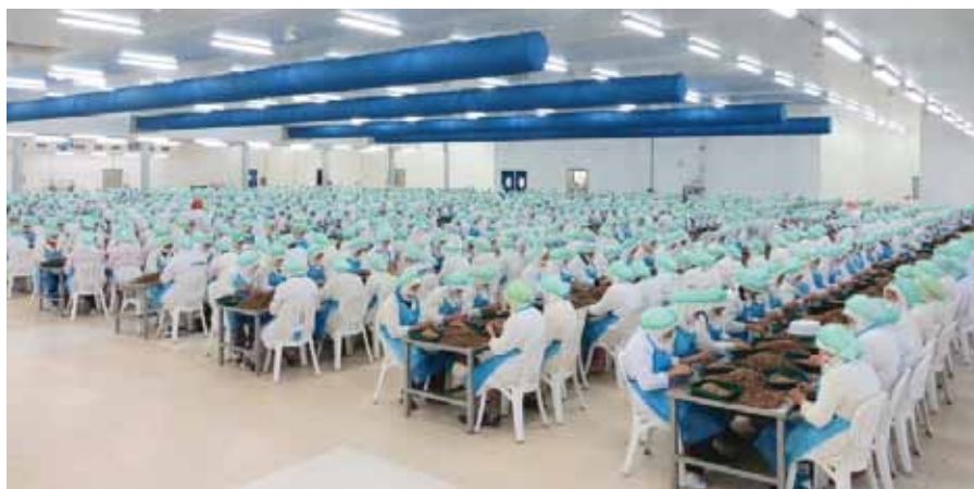
Garnaalpelsters in Marokko

verschoof deze arbeidsintensieve activiteit naar een industrieel proces: hetzij via speciaal uitgeruste pelateliers in lageloonlanden of anders (maar vooralsnog in geringe mate) via pelmachines.