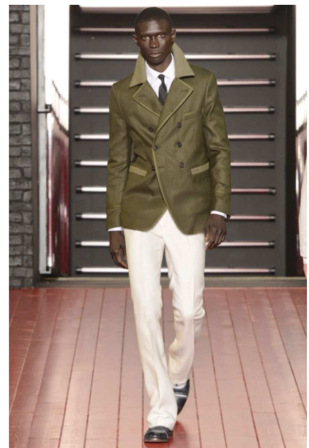
John Varvatos (lente-zomer 2013 / vlas-katoen) (printemps-été 2013 / lin-coton).

(Journal du Textile, 11.06.13 & 22.10.13)