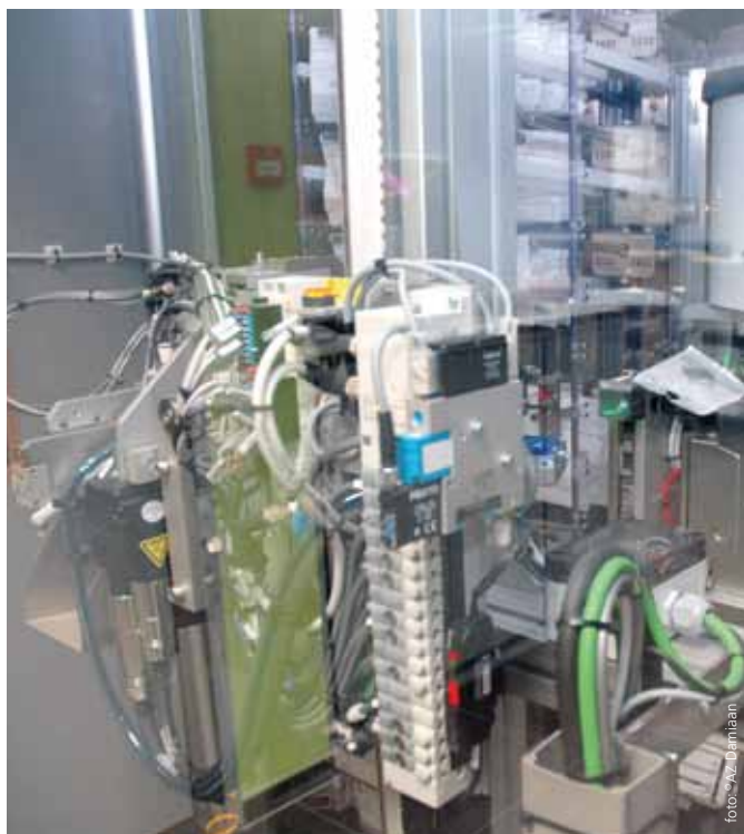
Zicht op de nieuwe gerobotiseerde ziekenhuisapotheek