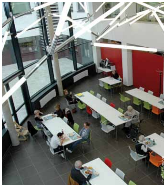
De nieuwe cafetaria

zijn er 120 meer dan in 2010. Het artsen-team bestaat uit 100 zelfstandige dokters. Het ziekenhuis realiseerde in 2011 een omzet van 117,5 miljoen euro (+5,4% in vergelijking met 2010). De resultaatcijfers zijn positief.