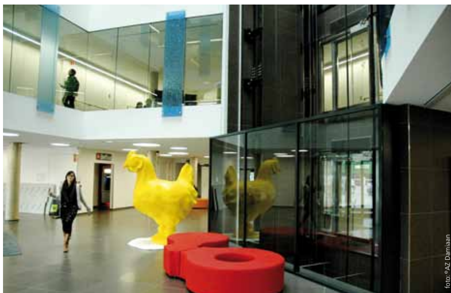
Inkomhal met kunstwerk van Kamagurka

► U kunt dit artikel lezen op tablet en downloaden via: www.westvlaanderenwerkt.be