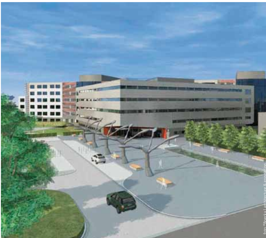
AZ Damiaan: nieuwe campus in Oostende opende in 2012

BRON: FOD Economie (ADSEI), Verwerking: Afdeling DSA, POM West-Vlaanderen.