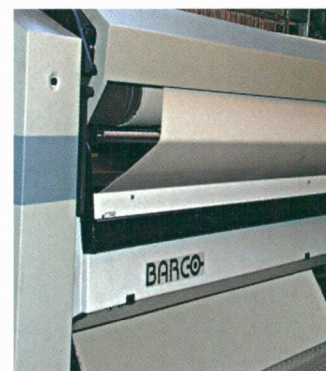
De productie bij De Witte Lietaer wordt gecontroleerd door Barco's WeaveMaster System