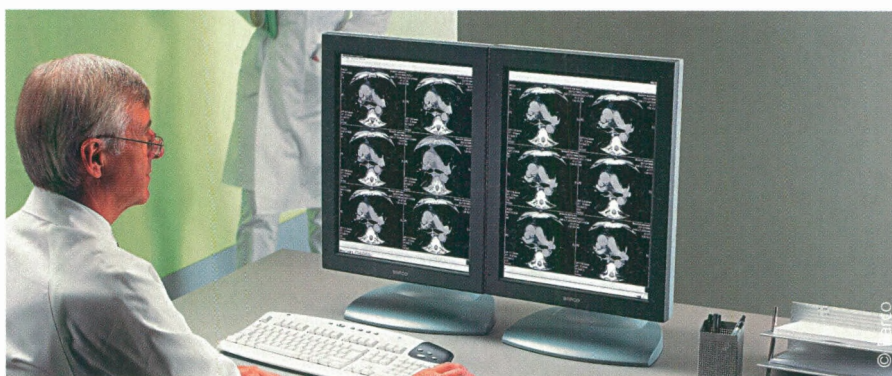
Steeds meer radiologen vertrouwen op Barco's medische beeldvormingoplossingen. Deze zullen op termijn de klassieke röntgenfoto's volledig vervangen.