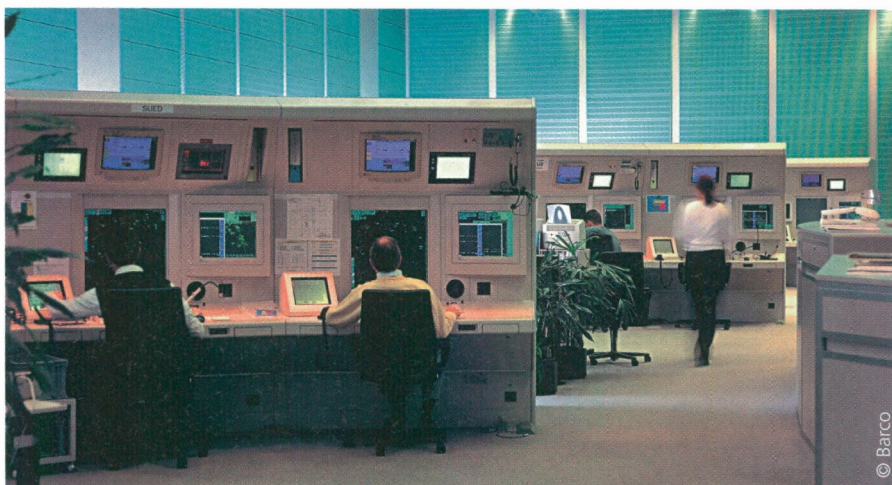
Barco beeldschermen in het controlecentrum voor de verkeersleiding in het Zwitserse luchtruim.

Zeker, en niet alleen voor de onderzoekers, ook voor anderen. R&D sluit immers best dicht bij de productie aan, of anders gezegd: waar R&D zit, zit ook productie en bijgevolg ook het aankopen, verzenden, service, enz.. In die zin creëert iedere researcher een vijftal