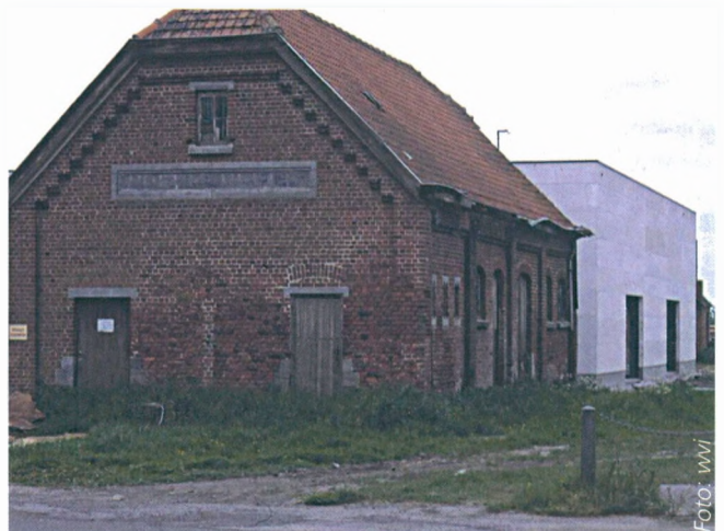
■ Een oud station in de Westhoek: Een weinig geslaagde combinatie van een 'vorige' en een 'nieuwe' laag bij de ontwikkeling van deze site.

PLATTELANDSGEBIEDEN DIE BIJ HUN VERDERE ONTWIKKELING INVESTEREN IN EEN VERSTERKING VAN HUN IDENTITEIT HEBBEN DE BESTE TROEVEN VOOR DE TOEKOMST