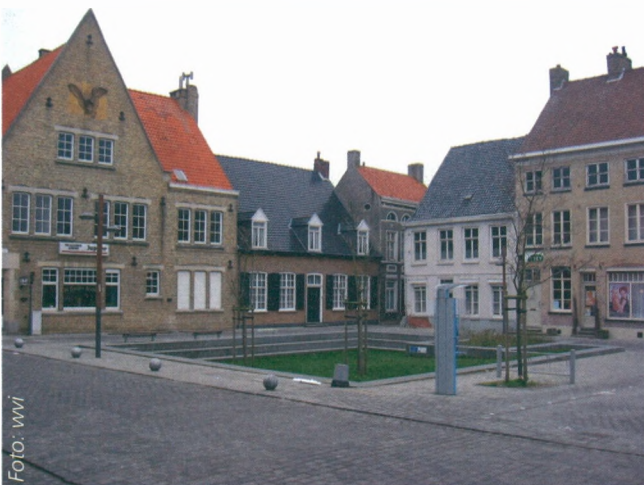
■ Dorpskern Roesbrugge: Een mooie realisatie met 'plekgebonden ontwerp'. Een oude dorpskern krijgt een nieuwe aankleding en meteen een nieuw élan.

Water spreekt tot de verbeelding. Tenminste als het niet gevangen zit in een weinig inspirerend korset. Waterbeheersing en -bevoorrading zoals de creatie van waterbuffers voor landbouw en industrie, watervertragende bekkens