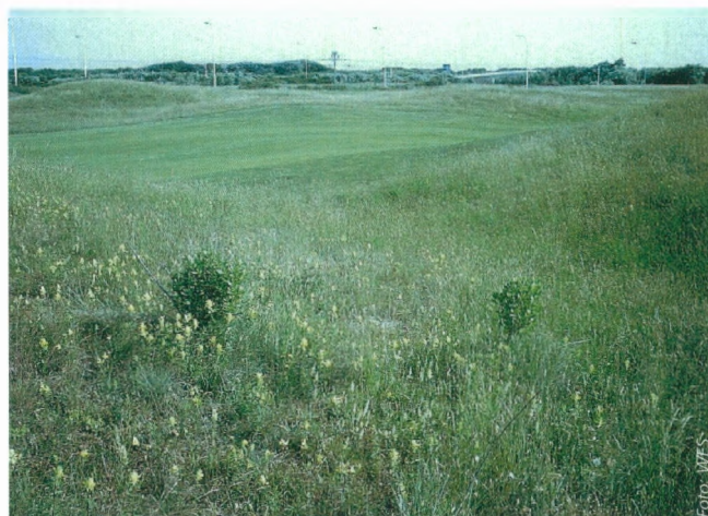
■ In woonzones vormen golfterreinen vaak nog het enige aaneengesloten gebied met een hoog natuurpotentieel. (Op de foto: Koninklijke Golfclub Oostende )

Soms gaat het om golfclubs die reeds 100 jaar op die locatie zijn gevestigd en door hun beheer overlevingskansen hebben geboden aan dieren en planten die elders moesten wijken vanwege de intensievere menselijke activiteiten. In West-Vlaanderen kunnen we de twee golfclubs in de duinen als voorbeeld aanhalen, nl. Koninklijke Golf Club van Oostende in De Haan en Royal Zoute Golf Club te Knokke-Heist.