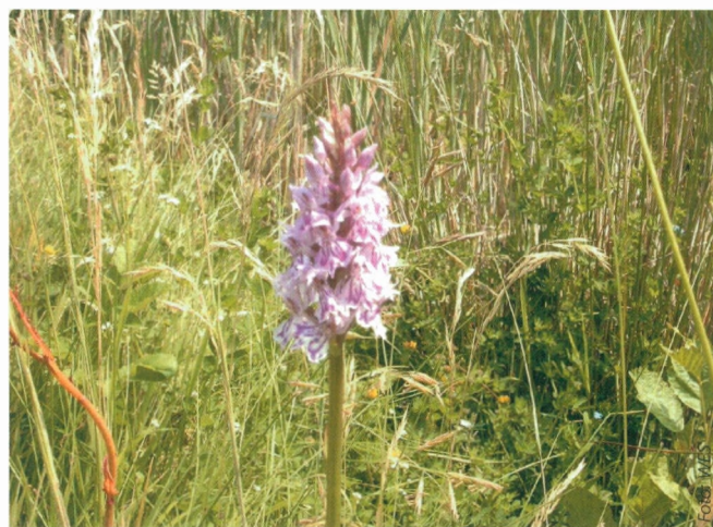
■ Op vele golfterreinen worden – ondanks het op golf gerichte beheer van het terrein – er waardevolle soorten aangetroffen. (Op deze foto: de gevlekte orchis op het golfterrein van Cleydaal).

In vergelijking met onze buurlanden – waar de populariteit enorm is – wordt de golfsport in Vlaanderen slechts door een kleine groep beoefend. Wij mogen evenwel aannemen dat