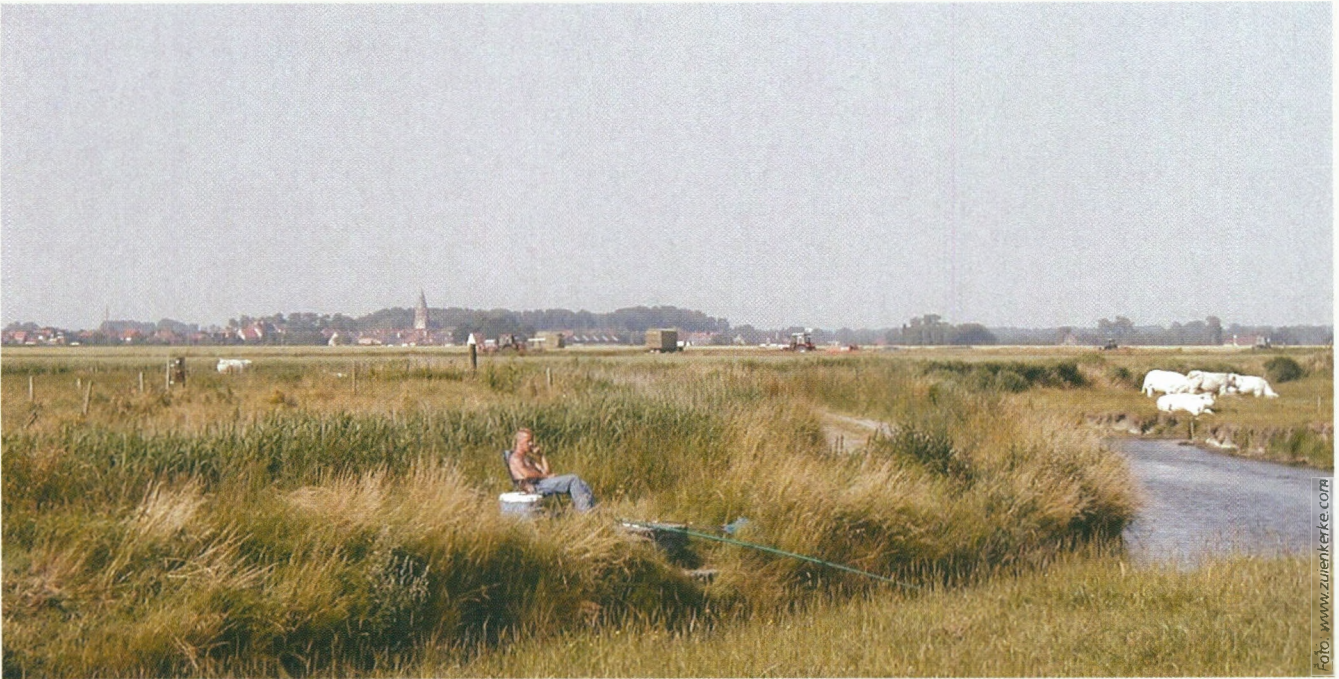
■ Zuienkerke, waar de leef- en woonomstandigheden het best werden beoordeeld.

Kortrijk, Wervik, Kuurne, Roeselare, Izegem, Wielsbeke, Harelbeke, Wevelgem, Spiere-Helkijn en Mesen). De appreciatie van de netheid door de inwoners van deze gemeenten ligt beneden het Vlaams gemiddelde.