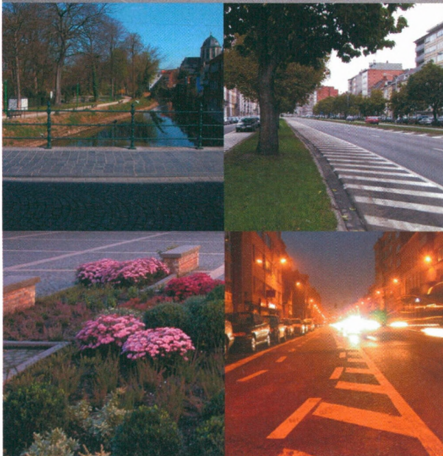
■ Analyse van de beeldkwaliteit van de publieke ruimte te Mechelen – een veelheid aan elementen en invalshoeken

een muziektent op de plaats van het viaduct, twee jongedames met een witte parasol waar nu de dynamietfabriek staat. Om de bewoners niet teleur te stellen moet de reiziger vol lof zijn over de stad van nu, maar tegelijkertijd moet hij er zich bewust van zijn dat de kritiek die hij uit op veranderingen binnen precies gestelde grenzen moeten vallen: hij moet erkennen dat als je de grootsheid en de welvaart van het tot wereldstad uitgegroeide Maurilia vergelijkt met de oude provinciestad Maurilia, er een zekere gratie verloren is gegaan, waarvan je echter nu pas kunt genieten nu je haar op oude kaarten ziet, terwijl eerst, toen Maurilia nog echt een provinciestad was, er werkelijk niets gracieus aan te zien was, en vandaag de dag nog veel