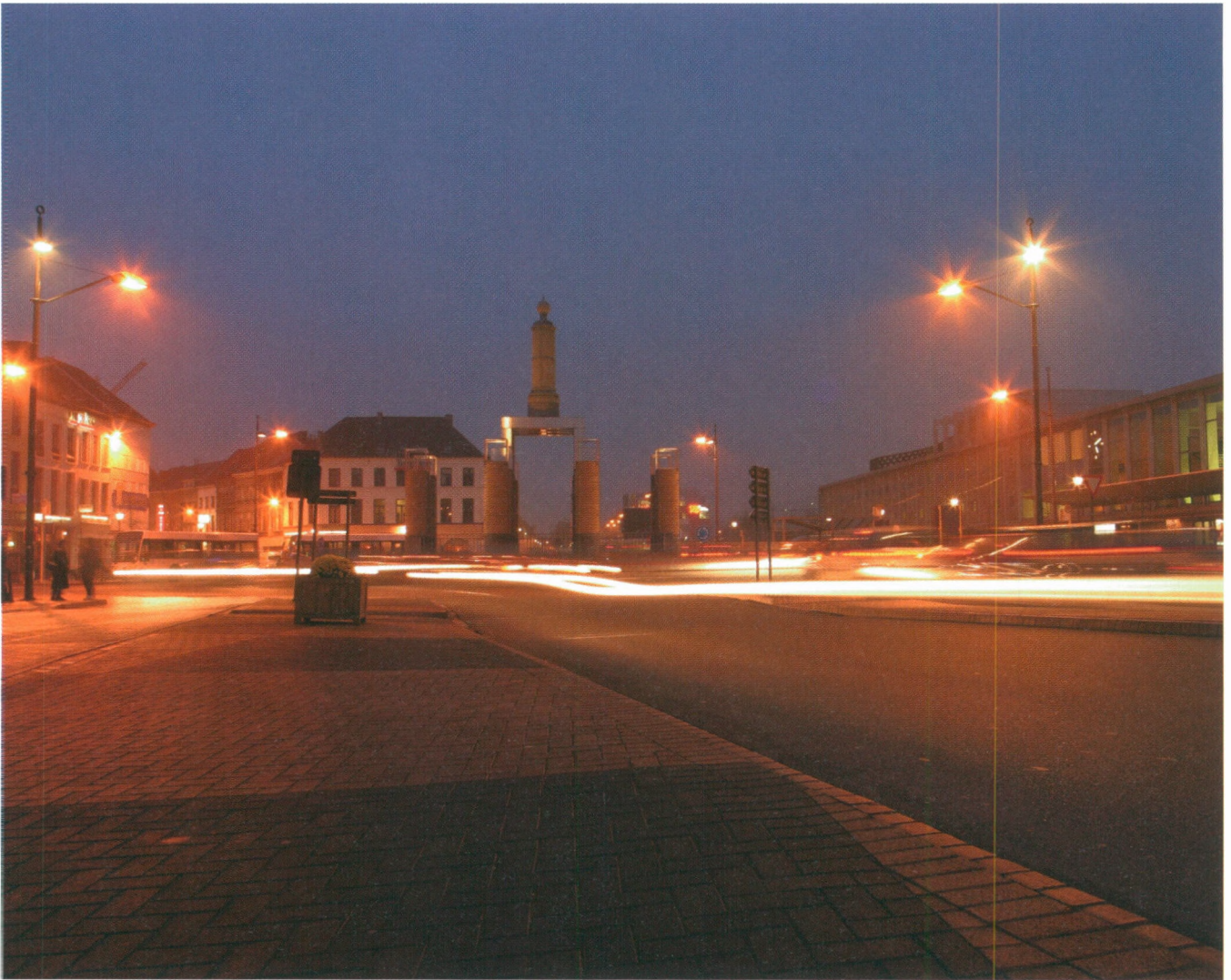
■ Beeldkwaliteitplan publieke ruimte Mechelen: Verlichting als belevingselement