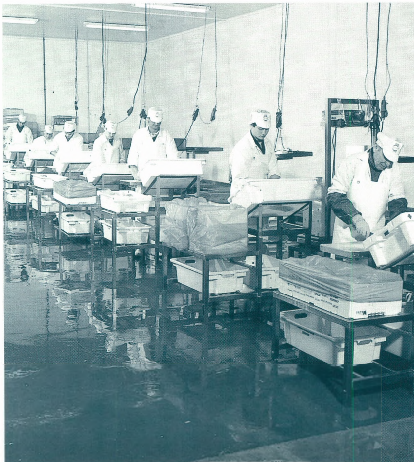
Portioneren van verse vis met de hand bij Pieters Visbedrijf, Brugge

Op demografisch vlak zijn gezinsverdunding, veroudering van de bevolking en de gezondheidsreflex de trends waarmee rekening zal moeten gehouden worden. Op maatschappelijk vlak wordt de voedingsindustrie geconfronteerd met een steeds mondiger consument, reductie van de keukentijd, het milieubewustzijn en het ethisch reveil. Op economisch vlak tenslotte zal men komen te staan voor onzekerheid (prijzendruk), de ontwikkeling van de distributie en de Europese Unie, onze thuismarkt.