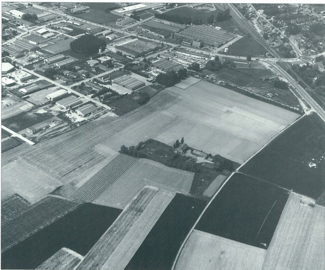
Poperinge Sappenleen Uitbreiding I: een uitbreiding van 12 ha wordt voorzien binnen het doelstelling 5b-programma.