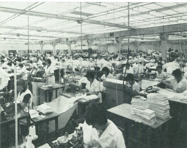
Binnenzicht konfektieatelier Hermans-Dielen, Deerlijk

Tussen 1957 en 1960 groeide de tewerkstelling aan van 5.321 tot 5.756 personen. De groei van de werkgelegenheid was zeer groot