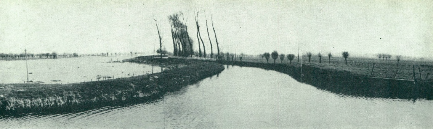
Westkerke. — Samenvloeiing van Bourgognevaart en Moerdijkvaart (voorgrond). — Rechts: bemalen gebied van Eernegem-Broek. — Links: niet bemalen, geïnundeerd gebied van Westkerke.

men in de zeepolders 29 wateringens (*), met een totale oppervlakte van bijna 40.000 ha. Hun taak behoort zeker niet tot de gemakkelijkste.